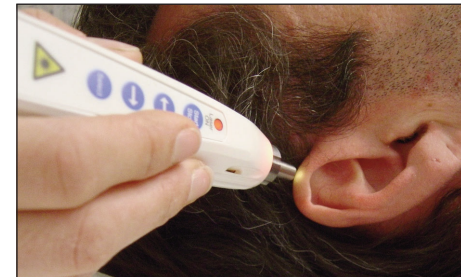
Abb. 2: Laserakupunktur am Ohr